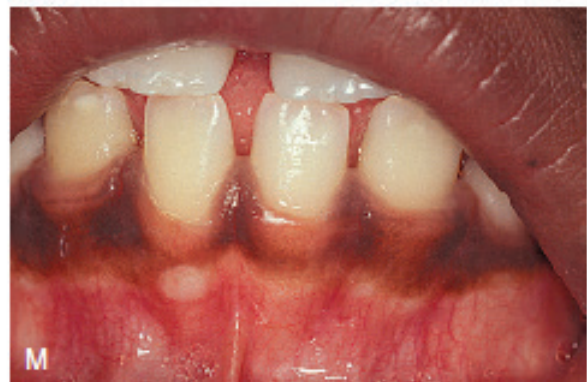
تصویر ۱-۲ ادامه: (F و G) حفره‌های گوشه لب (F) با عمق نشان داده شده به وسیله پروب پریدنتال (H) حفره‌های پارامدین لب (I) رتروکاسپید پاپیلا در لثه لینگوآل مندیبل. (J) زبان کوچک دوشاخه. (K) فرنوم لبیال هایپرپلاستیک ماگزایلا. (L) توروس پالاتینوس خط میانی کام سخت. (M) اگزوستوز کوچک آلوئول قدامی مندیبل، نمای فاسیال.